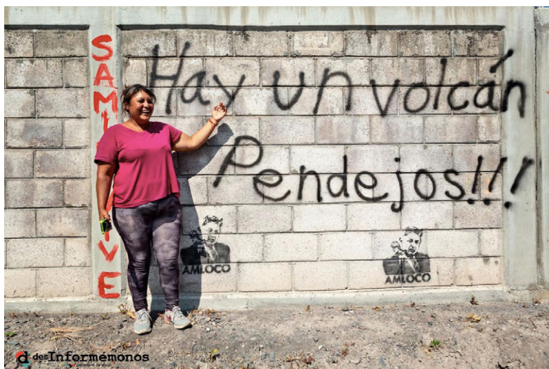
Imagen 3. PIM: Hay un volcán, pendejos!!!