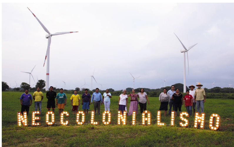
Imagen 4. Neocolonialismo en el Istmo de Tehuantepec