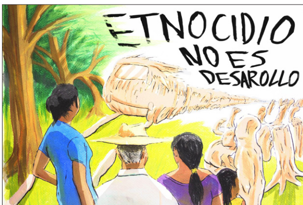
Imagen 1. Tren Maya: Etnocidio no es desarrollo.

Algunxs mayas, aún en este contexto, resisten. Son lxs que hoy reclaman que el proyecto del Tren “Maya” es ecocida por toda la devastación que realizara al territorio, las aguas, la selva, las plantas y los animales; es etnocida porque desaparecerá al pueblo maya, su cultura, su lengua, su territorio; es un engaño porque no se trata solamente de un tren sino de una serie de proyectos que en su conjunto destruirán la Península, y porque es un tren que le llaman maya, pero no es maya, ni es para su beneficio. Este tren no ayudará al pueblo maya con ‘desarrollo’, ‘empleo’ y ‘bienestar’, como plantea López Obrador en referencia a los megaproyectos. 11 El Tren “Maya” es un golpe como esos del pasado, pero que ahora levanta una gran indignación; este megaproyecto es la hacienda de henequén, es el conquistador que asesinó a Canek. Hoy es ayer.