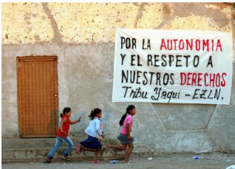
Imagen 5. Por la autonomía de la Tribu Yaqui

No podemos juzgar las tácticas de cada lucha ya que las van definiendo y construyendo de acuerdo con sus posibilidades, necesidades, tiempos, capacidades y condiciones. Tienen claro que las alternativas no están en el Estado, pero mientras las levantan buscan obtener y dar un uso contra-hegemónico a ciertas herramientas para avanzar en la defensa y el cuidado de sus territorios. No se trata, por eso, de estar contra un gobernante o un partido político sino de oponerse a una política económica extractivista, que 'significa la continuidad de la declaración de guerra hacia los pueblos, hacia la humanidad misma, hacia la vida misma' (Samantha).